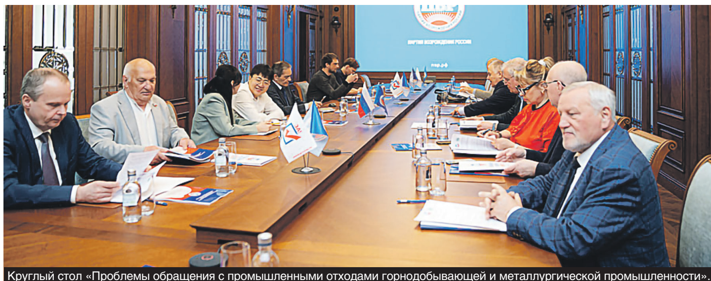
Круглый стол «Проблемы обращения с промышленными отходами горнодобывающей и металлургической промышленности».